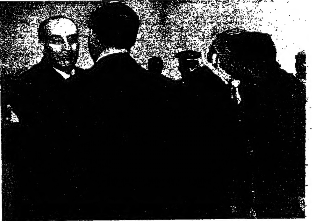
جلالة الحسين يصافح السيد بهجت القلوني رئيس الوزراء بينما يتعاقب سمو الامير محمد وسمو الامير حسن في المطار

نيوسيا - وصل الى هنا الدكتور غونار يارينغ المبعوث الدولي للشرق الاوسط بعد اختتام محادثاته التي اجراها مع ابا ايان وزير خارجية اسرائيل ، وقد ذكرت اذاعة باريس ان المصادر الاسرائيلية تعتقد ان يارينغ لم يحقق اي تقدم في مهمته بسبب تصليب اسرائيل في موقفها من القضايا التي يحتها يارينغ مع ابيان وفي مقدمتها اخراج السفن المحتجزة